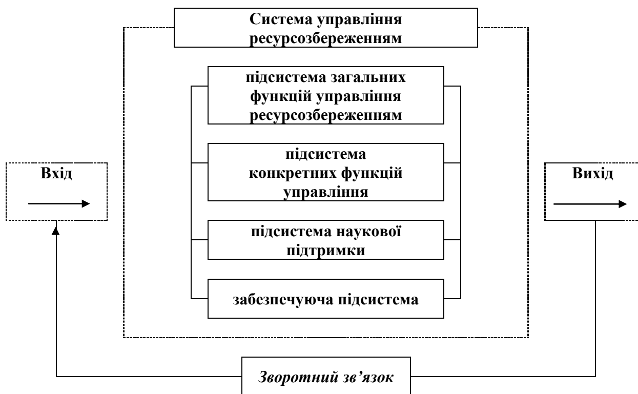
Рисунок 1.1 – Внутрішня система побудови системи управління ресурсозбереженням

Внутрішня система побудови управління ресурсозбереженням складається з взаємозв'язаних підсистем: підсистеми загальних функцій управління ресурсозбереженням, підсистеми конкретних функцій управління ресурсозбереженням, підсистеми наукової підтримки а також забезпечуючої підсистеми (рис. 1.1).